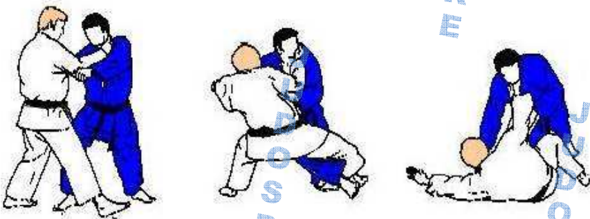
Petit fauchage intérieur