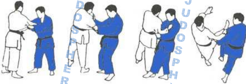
Petit fauchage extérieur