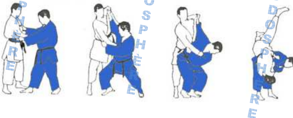
Projection de hanche en soulevant