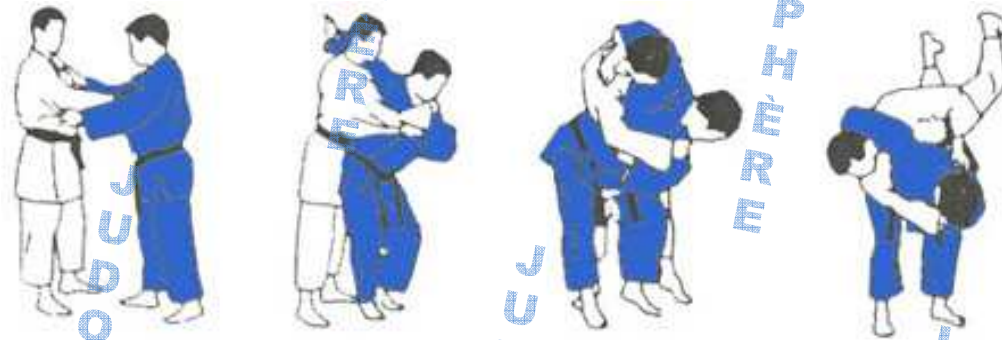
Roue autour des hanches